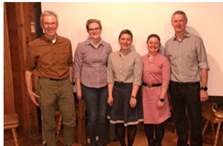
Die neue und alte Vorstandschaft