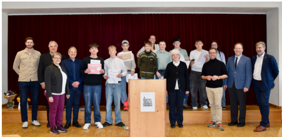
Stolz zeigten sich die drei besten Teams bei der Preisverleihung in großer Runde. Es gratulierten Tal-Bürgermeister und Schulleitung.