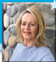
Anzeigenagentur Ida Schmid