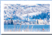
#1 Tegernsee Schlosskirche

0,50 € pro Karte an die „Gmunder Tafel“ um Menschen in unserer Region zu helfen