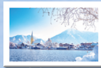
#3 Rottach-Egern, Malerwinkel