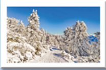
#7 Winter Wald