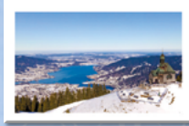
#9 Tegernseer Tal