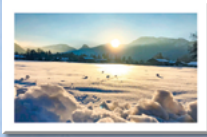
#4 Sonnenuntergang am Hirschberg