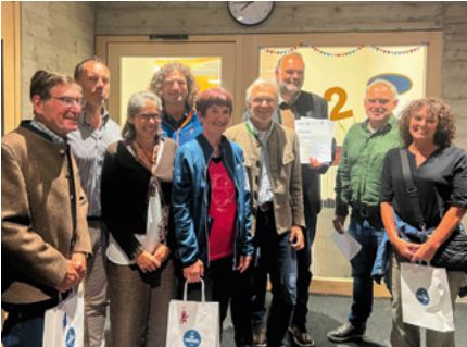
Einige Teilnehmer des Stadtradeln 2025 erhielten Urkunden und kleine Präsente