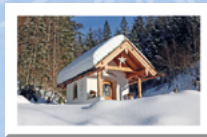
#15 Kapelle „Maria im Walde“