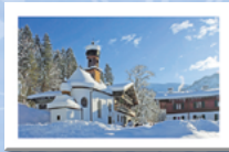
#12 Wildbad Kreuth