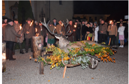
Zuvor hatten die heimischen Jäger vor der Kirche auf einem Anhänger den diesjährigen Hubertushirschen traditionell geschmückt zur Ehrung hergerichtet. Er stammt aus einem heimischen Revier, ein 14-Ender.

Diese Grundhaltung ist eng verknüpft mit dem heutigen Verständnis von Waidgerechtigkeit. Sie umschließt Tier- und Umweltschutz sowie Respekt gegenüber Mitmenschen.