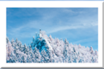
#10 Riederstein Kapelle