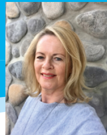
Anzeigenagentur Ida Schmid