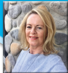
Anzeigenagentur Ida Schmid

Wenn Sie unsicher sind, kontaktieren Sie mich.