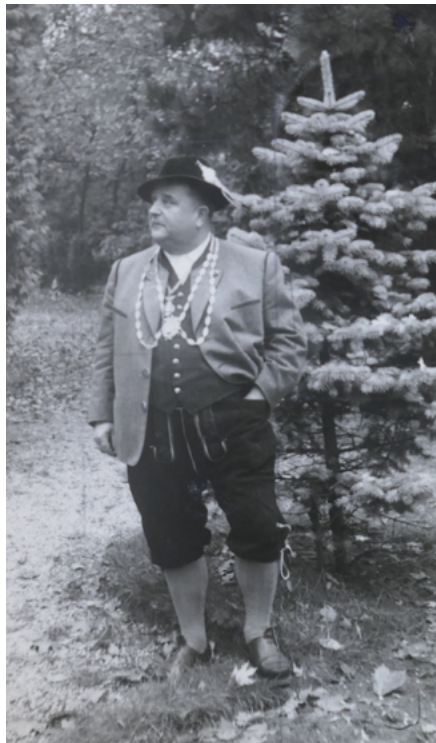
1956 als Berliner Schützenkönig

Sein Leben lang war er ein treffsicherer Schütz: 1925 wurde er in Frankfurt am Main Deutscher Meister im Kleinkaliberschießen, wiederholt wurde er Berliner Schützenmeister: