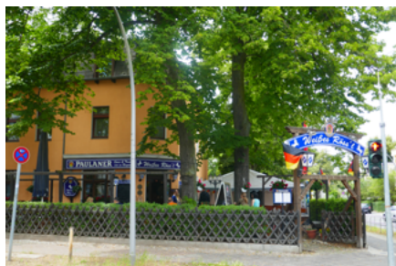
Die Gaststätte „Weißes Rössl“ in Berlin-Lichterfelde im Juni 2024

1961 verstarb Quirin Lindmayr 62-jährig nach schwerer Krankheit. An den Wänden der Gaststätte „Weißes Rössl“ in Berlin - Lichterfelde hängen noch heute zahlreiche Bilder, Zeitungsausschnitte und andere Erinnerungsstücke aus dem Leben des Rottacher Lukas Quirl in Berlin.