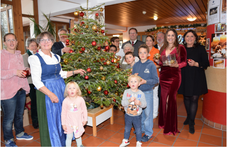
Rote Kugeln und Lichter zieren den Christbaum im Foyer des Schwaighofs. Bewohner, Kinder und Mitglieder des Helferkreises haben ihn geschmückt.