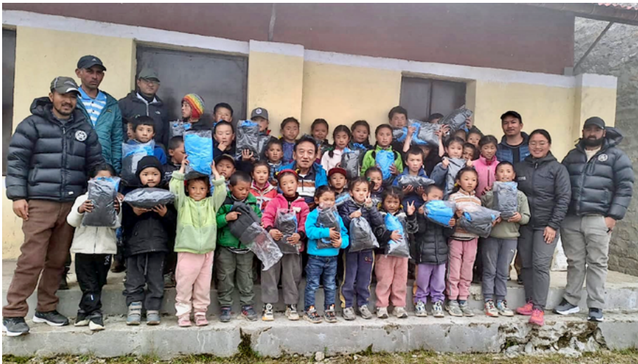
Die geretteten Kinder aus dem 3.800 m hoch gelegenen Bergdorf Thame in der Everest-Region, zusammen mit der Lehrerschaft, angekommen in Khumjung.

Die Welt-Presse berichtete über diese Tragödie ausführlich.